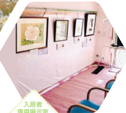
入居者 専用展示室